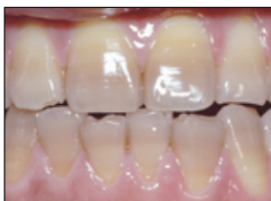
Mässige bis mittelstarke Tetracyclin-Verfärbungen