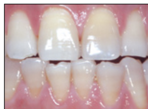
Eindrucksvolle Verbesserung nach nur zwei Wochen. Mitunter benötigt die Behandlung 2–6 Monate 7 .